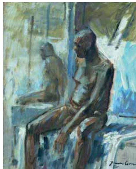
Jan van Loon, 'Kunst en Kitsch', 2017. Olieverf op doek, 100 x 100 cm.

Museum Møhlmann Westersingel 102-104 Appingedam www.museummohlmann.nl 01-04 t/m 27-05