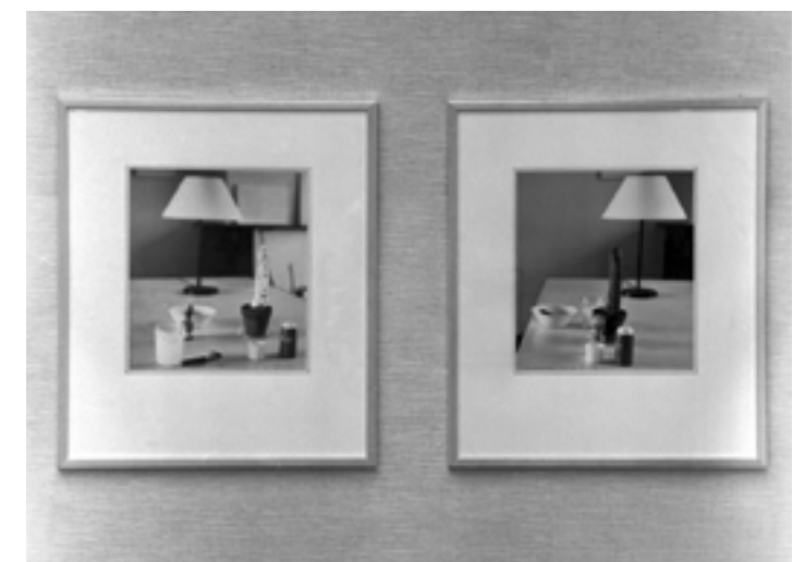
GER VAN ELK, The Well-Shaven Cactus, 1969-1971, 2 zw/w foto's met kleur retouches, afzonderlijk ingelijst, (2x) 70,5 x 60,5 cm