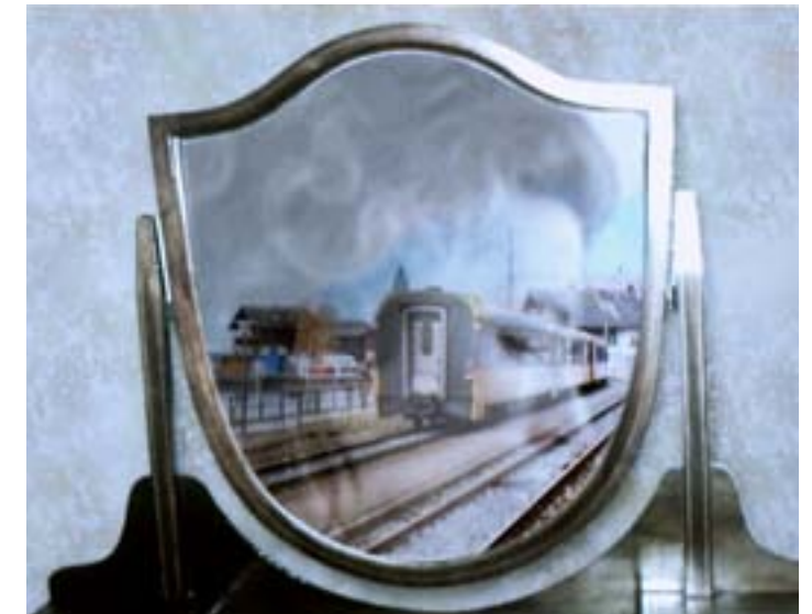
GER VAN ELK, Adieu a K , 2004, flashcard, LCD-scherm, in passepartout in eikenhouten lijst, 56 x 62 cm

"Ik ben geen kunstenaar. Niet in de traditionele zin. Nieuwsgierigheid is de drijfveer voor iedere kunstenaar, maar ik ben ook getraumatiseerd door het leven. Ik heb de frivoliteit, de levenslust en de gekte van mijn vader. Hij maakte The Flintstones in Hollywood en ging echt diep in de oppervlakkigheid. Mijn moeder daarentegen was heel burgerlijk, uit een keurige leraarsfamilie. Mijn hele structuur van denken wordt daardoor bepaald. Ik ben van jongs