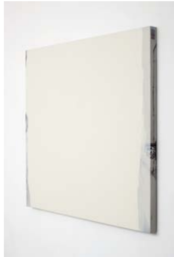
📍 GER VAN ELK, Conclusions II - Vejer de la Frontera 'Yellow' , 2012, acrylic paint on photograph on canvas, 123 x 126 x 5,7 cm, Courtesy GRIMM