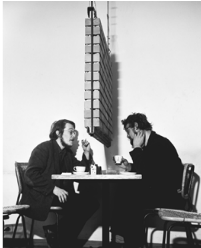
📍 GER VAN ELK, Hanging Wall , 1968, bakstenen, metalen constructie, staaldraad, koffietafel, 2 stoelen, 95 x 75 x 5 cm, Courtesy GRIMM

"Hij zag de psychologie van het verhaal." Als voorbeeld noemt Van Elk de Kinselmeer -serie. Van Elk maakte vanaf de jaren negentig foto's van het meer die hij met verf en inkt bewerkte, waarna hij de