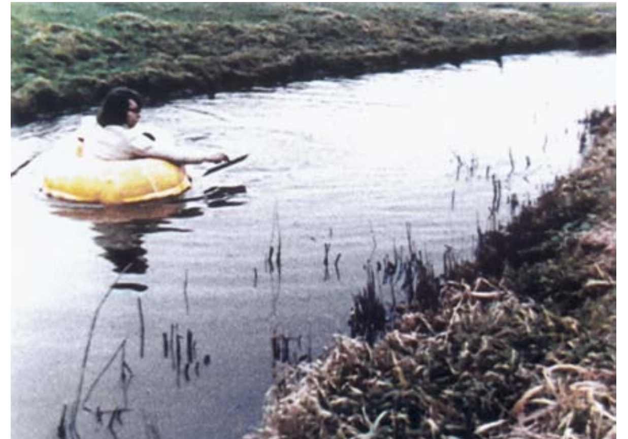
📍 GER VAN ELK, The Flattening of the Brooke's Surface , 1972, 16 mm film (kleur), overgezet op video, Courtesy GRIMM