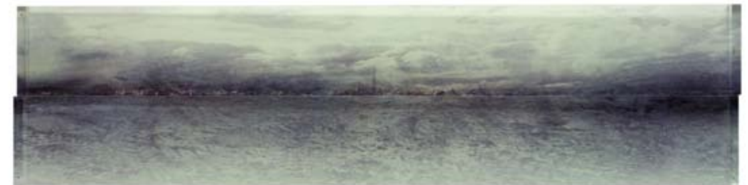
📍 GER VAN ELK, Kinselmeer, Studie St. Bavo , 2001, retouche ink op cibachrome tussen plexiglas, 39 x 154 x 6,5 cm